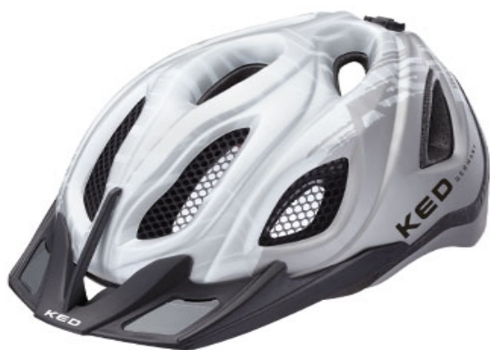
KED Certus weiß matt

http://www.ked-helmsysteme.de/de/maxshell-technology