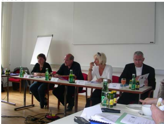
Abb. 5: Die Gesundheitssprecher der im Parlament vertretenen Parteien (SPÖ, Grüne, ÖVP, FPÖ) auf der WIGMU Tagung in Bad Aussee 2007.

ausbildung, Reform des UG 02, Leistungsvereinbarungen, Aufwertung der Betriebsräte durch Stimmrecht im Universitätsrat, Mitbestimmung der UniversitätslehrerInnen Kollektivvertrag, Einführung einer Personalkommission zur Überprüfung der Qualifikationsvereinbarung und/ oder Konfliktbewältigung/Mobbing wurde aus unterschiedlicher Sichtweise – Regierung, Opposition – beleuchtet. Es war von großer Bedeutung, dass in den nachfolgend gestellten Fragen und in der Diskussion den Wissenschaftssprecherinnen und -sprechern klar und deutlich aufgezeigt wurde, wie es tatsächlich an den österreichischen Universitäten (Arbeitszeitüberlastung, hoher Prozentsatz klinischer Arbeit, nicht ausbezahlte Zeitausgleich und Überstunden, Zielvereinbarungen, usw.) aussieht.