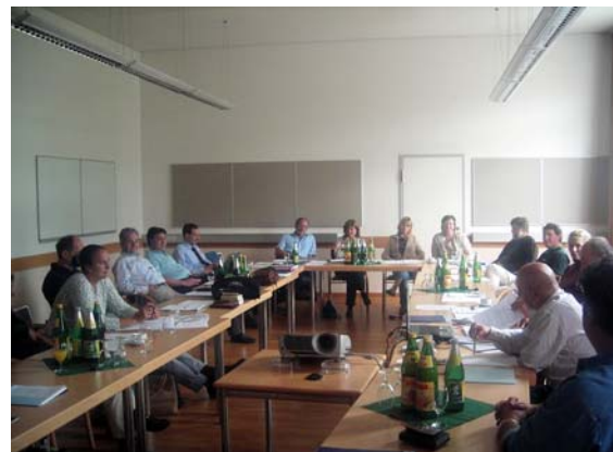
Abb. 1: Erste WIGMU Tagung Bad Aussee 2005