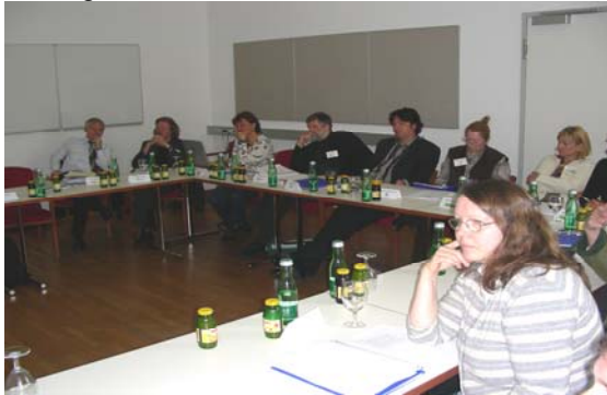
Abb. 7: TeilnehmerInnen aus Wien, Graz und Innsbruck auf der WIGMU Tagung in Bad Aussee 2007

ausgehandelt wurde, ist das Papier eingehend diskutiert worden. Dabei wurde von den anwesenden VertreterInnen festgestellt, dass zwar gewisse Punkte berücksichtigt wurden, jedoch wesentliche Nachbesserungen notwendig sind. Es gibt daher ein eindeutiges Votum hinsichtlich einer Zustimmung nur unter der Bedingung einer Nachbesserung im Bereich der Überstundenregelung, gleichwertiger Teilzeit-Journaldienst-Bezahlung und einer post-doc Stufe gemäß FWF Ansätzen.