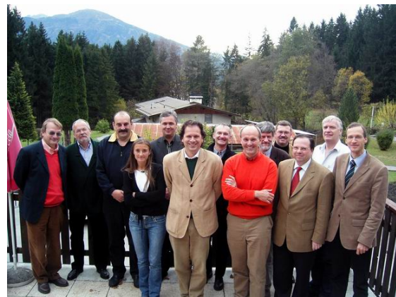
Abb. 6: WIGMU Tagung Gramartboden bei Innsbruck, 2005

Bei allem Verständnis für flexible Arbeitszeiten muss im Mittelpunkt unserer Überlegungen der Erhalt der Arbeits- und Lebensqualität der Ärztinnen und Ärzte stehen.