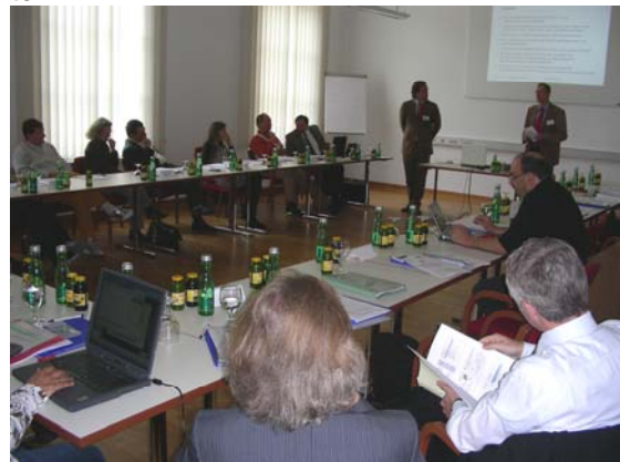
Abb. 4: WIGMU Tagung Bad Aussee 2007

Auf diesen Sitzungen wurden mehrere Arbeitsthemen diskutiert, Gemeinsamkeiten gesucht, aber auch informative Vorträge abgehalten.