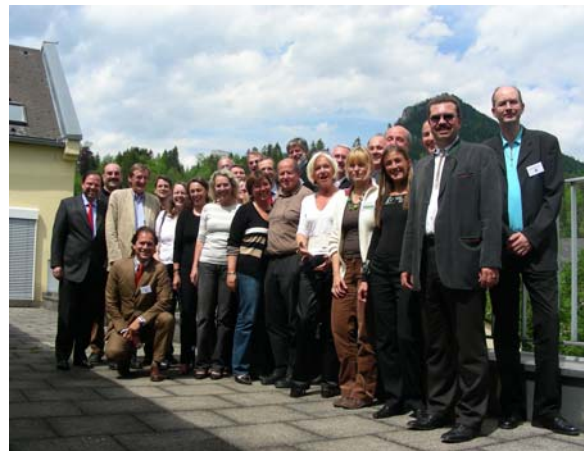
Abb. 14: Die TeilnehmerInnen mit den Referenten der WIGMU Tagung in Bad Aussee 2007

Insgesamt waren diese Tagungen der Betriebsräte der Medizinischen Universitäten Österreichs wichtige, arbeitsintensive, informative und konstruktive Sitzungen, die viele vergleichbare Probleme an den jeweiligen Universitätsstandpunkten aufzeigten und viele Gemeinsamkeiten erkennen ließen. Nur durch ein Miteinander können wir letztendlich erfolgreich sein. Wenn wir es erreichen, dass wir von der Politik beachtet werden, können wir als Gegenstück zur Rektorenkonferenz angesehen werden; die Anfänge sind gemacht, jetzt heißt es mit Elan weiterarbeiten.